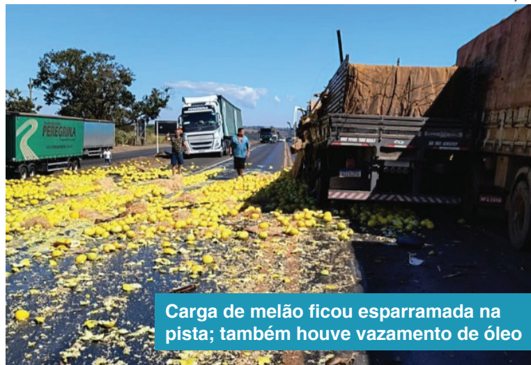
Carga de melão ficou esparramada na pista; também houve vazamento de óleo

ANUNCIE | 34 99862-5000 WWW.DIARIDEUBERLANDIA.COM.BR