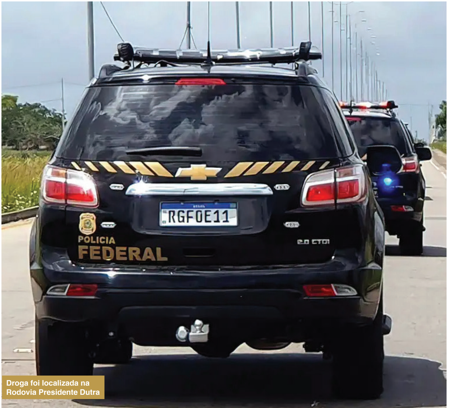
Droga foi localizada na Rodovia Presidente Dutra