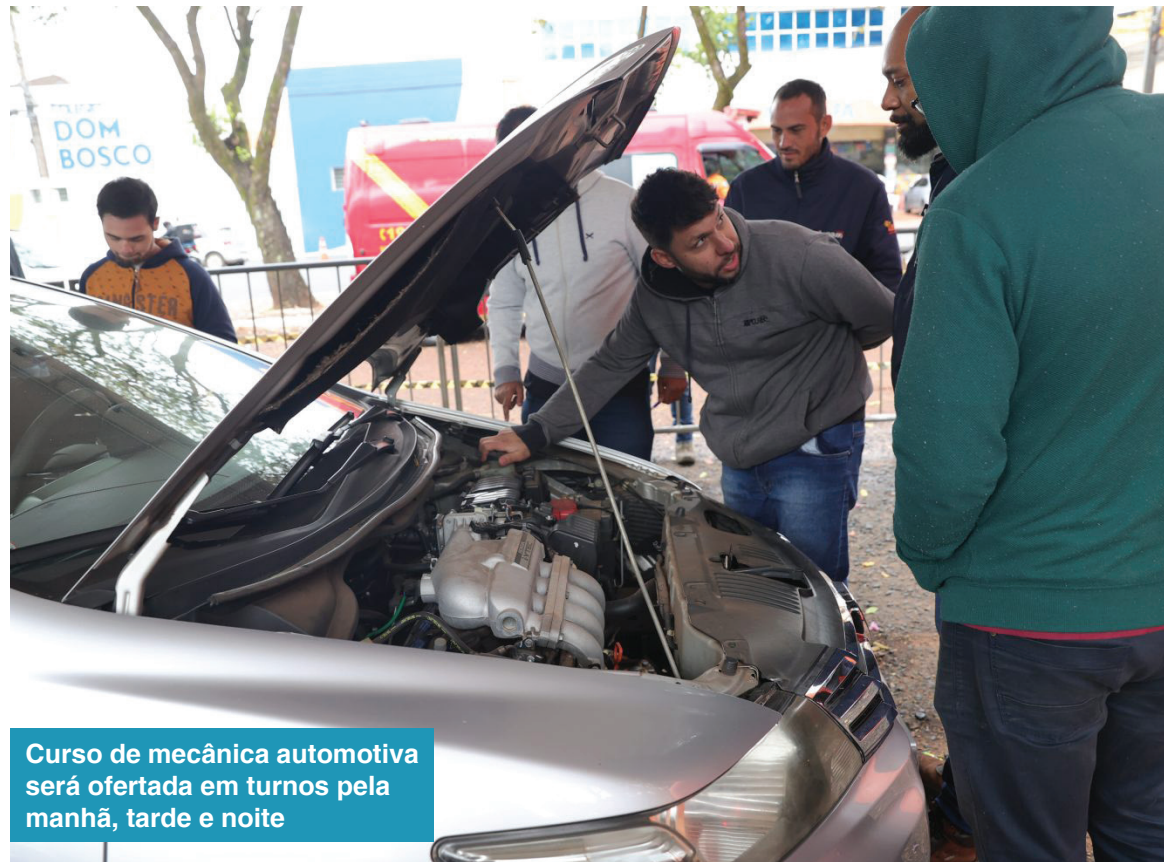
Curso de mecânica automotiva será ofertada em turnos pela manhã, tarde e noite

• Atendente de Telemarketing Período: 03 a 07/06 Segunda a Sexta