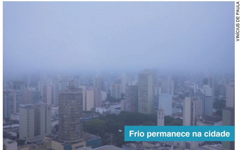
VINÍCIUS DE PAULA